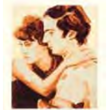
Benedict Wells Vom Ende der Einsamkeit

Wir erfahren viel über die ungewöhnlichen Lebenswege der Kinder Jules, Marty und Liz, aber auch über die große Liebe im Leben und das Überwinden des Verlusts der Eltern.